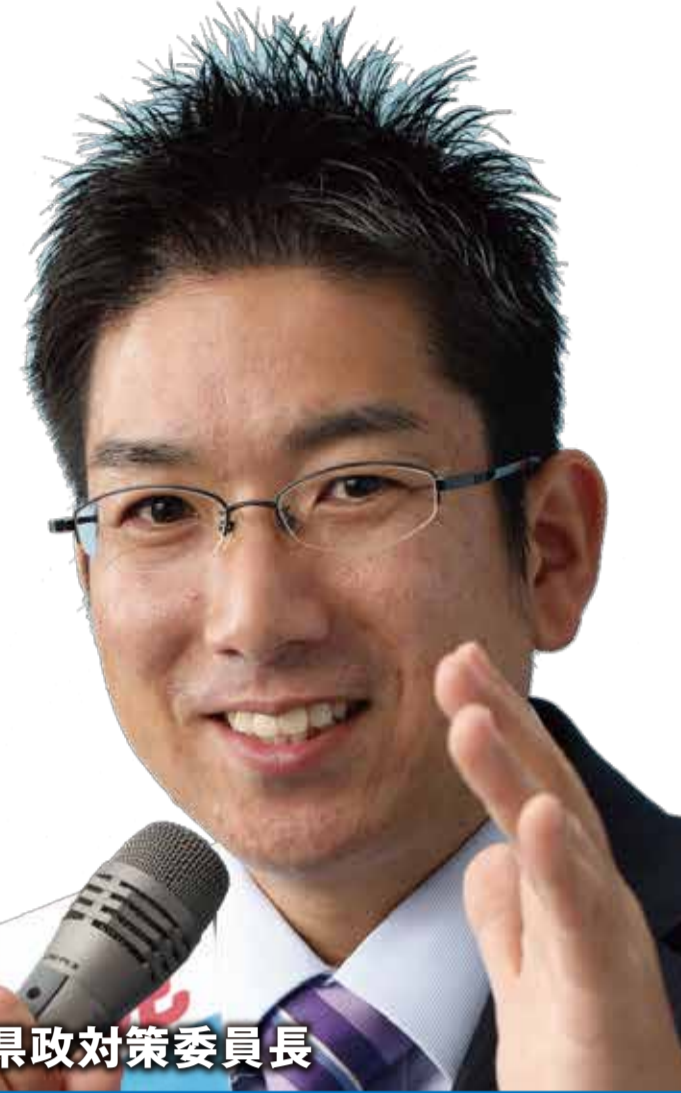
党飯田市区県政対策委員長