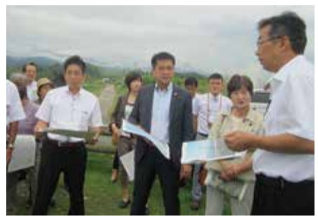
リニア新幹線問題で現地視察する 県議団(14年9月)

県民世論で廃止になった「海外視察」が復活の動き 県民世論で「ムダ」と廃止が決まった公費での海外視察。ところが今になって「鎖国化してもいいの？」と、復活をめざす動きも出ています。