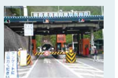
朝夕の通行料が半額になった 三才山有料道路のゲート