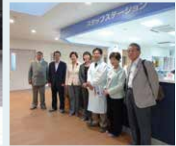
新設された 上田市立産婦人科病院を視察